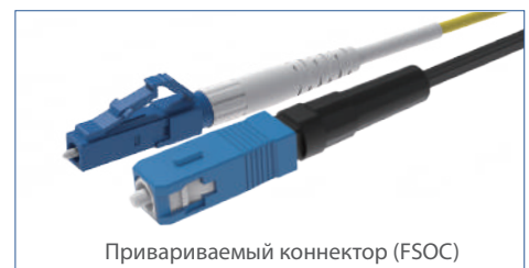
Привариваемый коннектор (FSOC)